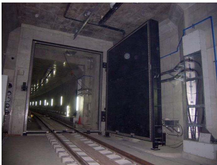
止水鉄扉設置状況（天満橋駅西側）

一方、止水板および止水鉄扉の運用は、京阪電気鉄道株が担当しており、同社では現業各部門担当者を招集して、毎年1回「止水板および止水鉄扉取扱いの実地訓練」を行う等、鉄道や河川施設への被害が最小限となるよう取り組んでいます。