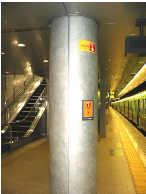
ホーム異常通報装置

お客さまがホームから線路に転落された場合に、接近する列車から待避できるよう、全区間のホーム下に待避できるスペースを設けています。