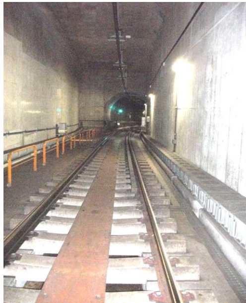
ガードレール設置状況

列車が急曲線部を通過する際には、レール上に車輪が乗り上がって脱線する可能性があります。このような脱線を防ぐため、半径400m未満の曲線に脱線防止用のガードレールを設置しています。