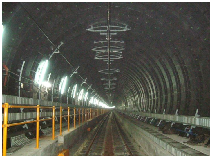
なにわ橋駅～天満橋駅間 シールドトンネル

また、なにわ橋駅～天満橋駅間のシールドトンネル部分では上町断層を横切りますが、ダクタイル(鑄鉄)セグメントを使用することにより、想定しうる変位においてはトンネルが破壊しないことを確認しています。