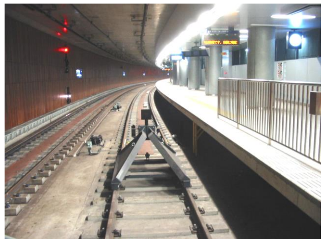
ホーム下待避スペース